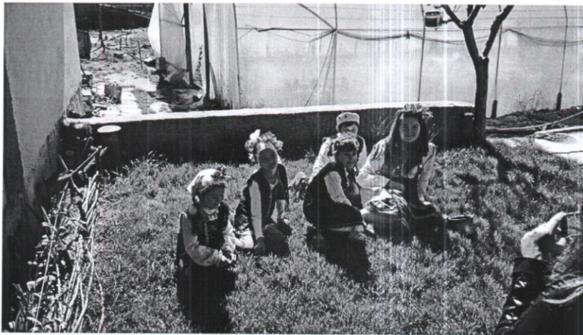
Лазарки от село Белица

събират и тръгват да обикалят къщите на хората за здраве и берекет.